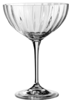
Vignoble 21 optic