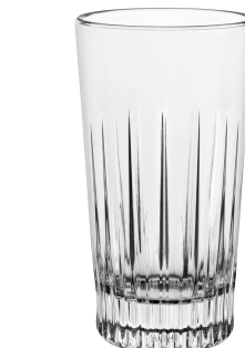
Cocktail Long Drink