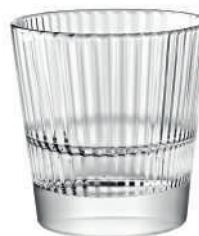
Diva 2.4.6. Dof